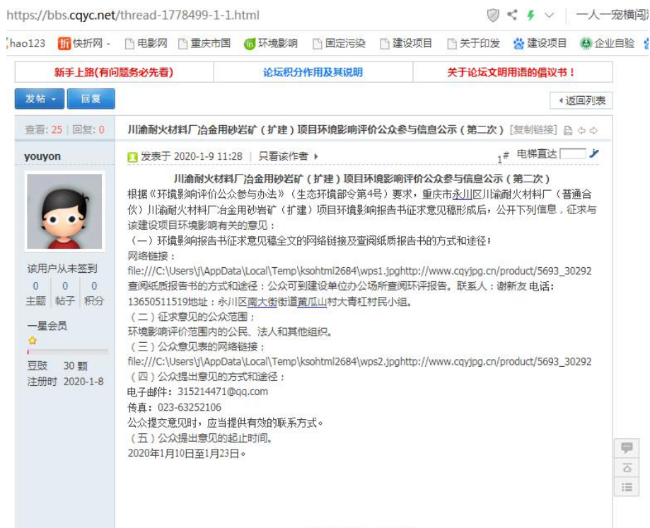
图 4.1-1 第二次环境影响评价信息公示（网络平台公示）