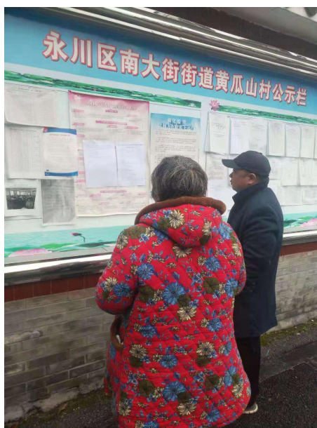
图 4.4 现场张贴公示

张贴公示时间：2020年1月10日~1月23日，共10个工作日。现场张贴公示情况详见图4.4。