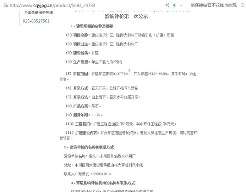
图 3.1-2 第一次网络公示截图